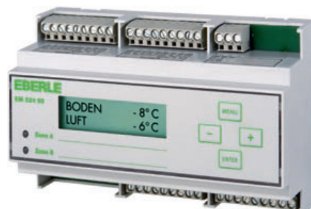
EM 524 90 – für 2 Zonen / for 2 zones