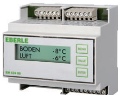
EM 524 89 – für 1 Zone / for 1 zone